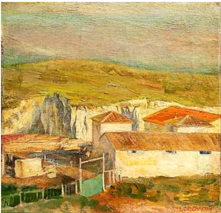
La fabbrica di mattoni rossi

Consegue il Diploma accademico per l'abilitazione all'insegnamento di disegno ornamentale nelle scuole secondarie e poi un secondo diploma accademico in figura disegnata e dipinta. Nel 1906 espone la sua prima opera, un grande autoritratto con uno sfondo di nuvolaglie e di fronde, alla Promotrice per le belle arti di Firenze. Nello stesso anno conosce Emilio Cecchi, uno dei più importanti critici e saggisti del tempo, con il quale si sposa nel 1911 e si trasferisce a Roma con il marito. La loro casa in via Nomentana diventa un "salotto letterario", dove si incontrano artisti e intellettuali di grande fama.