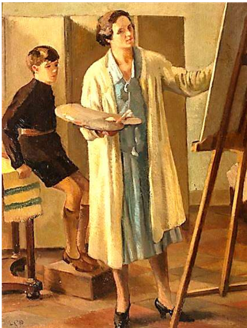
L'artista nello studio

La Pieraccini lavorò al fianco di Armando Spadini, pittore fiorentino profondamente interessato all'impressionismo, anch'egli trasferitosi a Roma nello stesso periodo della famiglia Cecchi.