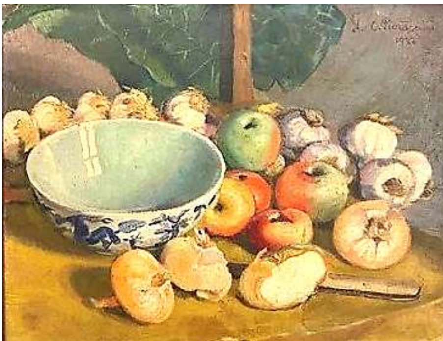
natura morta con ciotola

La Galleria Lyceum di Firenze le dedica una ricca e importante mostra personale dove espone quarantasei opere a olio e alcuni monotipi. Nei suoi lavori mostra sapienza nel disegno e sensibilità coloristica che la rendono padrona del "mestiere" di pittrice.